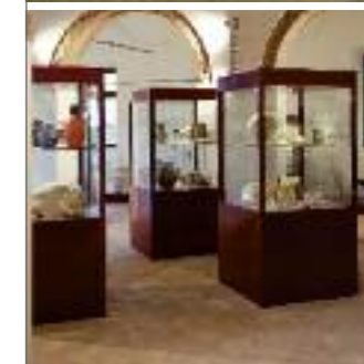
museo della ceramica CIVITACASTELLANA - VITERBO