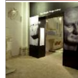
museo civico CITTAREALE - RIETI