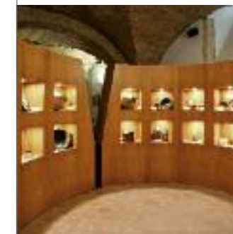
museo storico ALVIANO - TERNI

Uno spiccato intuito nelle esecuzioni eleganti, in diversi materiali.