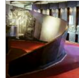
museo del vino CASTIGLIONE IN TEVERINA - VITERBO